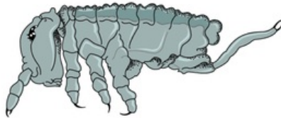
Collembole taille réelle : 5 mm

Tous les êtres vivants (champignons, bactéries et animaux), souvent microscopiques ou de petites tailles, ont une importance capitale dans la formation du sol. Ils permettent la décomposition biologique du sol.