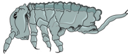
Collembole taille réelle : 5 mm

Tous les êtres vivants (champignons, bactéries et animaux), souvent microscopiques ou de petites tailles, ont une importance capitale dans la formation du sol. Ils permettent la décomposition biologique du sol.