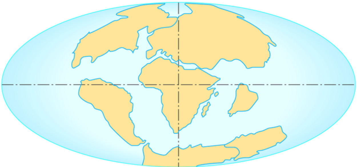
La Terre, il y a 60 millions d'années

La dislocation de la Pangée a commencé au milieu de l'ère secondaire, au Jurassique, il y a 165 Ma, avec l'ouverture des océans Atlantique et Indien. Pendant que l'Amérique s'éloigne vers l'ouest, l'ensemble des continents remonte vers le nord. L'Afrique, l'Arabie et l'Inde se rapprochent de l'Eurasie et conduisent à la fermeture progressive de la Téthys, dont la mer Méditerranée est le dernier vestige.