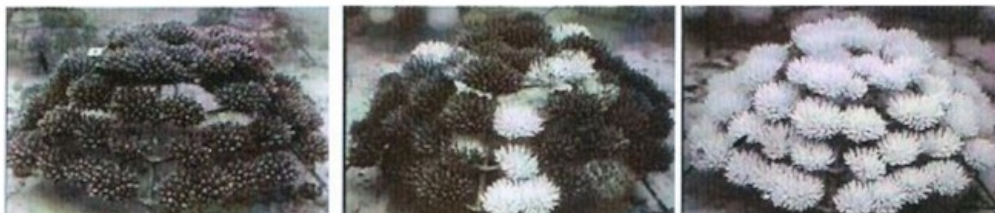
Photographies de coraux sains, en cours de blanchissement et complètement blancs. (Marinesavers, 2016)

On constate actuellement que l'augmentation de la température des eaux de surface des océans due au réchauffement climatique provoque le blanchissement des coraux.