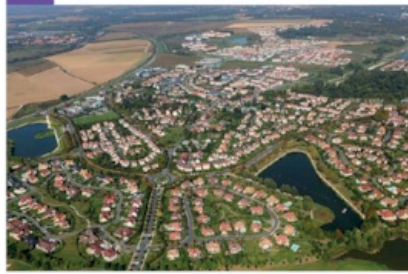
Magny-le-Hongre (commune du Bassin parisien)