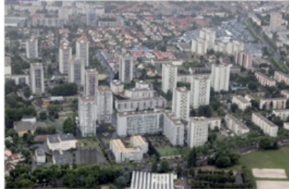
La Courneuve (commune près de Paris)

Associez chacune des photographies à un espace du schéma :